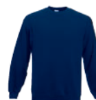
8316x.M námořní modrá*