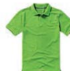
7338x.Z zelené jablko