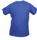
7103x.M královsky modrá