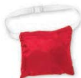
složitelná do jedné kapsy