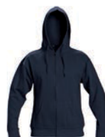
8643x.M námořní modrá