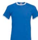
8303x.M královsky modrá/bílá