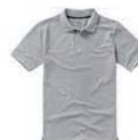
7519x.J šedý melír*