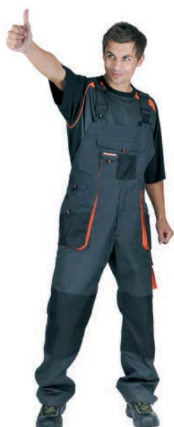
9018x.C s laclm