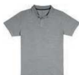
7918x.J šedý melír*