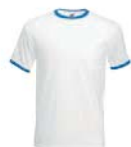
8307x.B bílá/královsky modrá