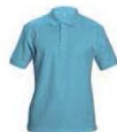
8639x.M nebesky modrá