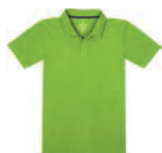
7914x.Z zelené jablko