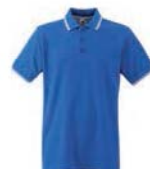
8321x.M královsky modrá/bílá