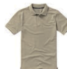
7327x.P khaki béžová