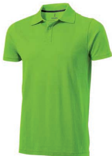
7664x.Z zelené jablko