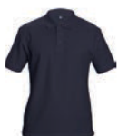
8633x.M námoňní modrá