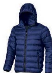
7498x.M námořní modrá