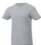
7576x.J šedý melír*