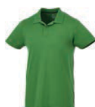
N 7923x.Z středně zelená