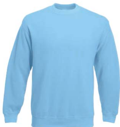
8318x.M světle modrá