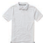
7329x.B bílá/námoňní modrá