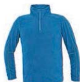
7927x.M modrá klasik/světle modrá