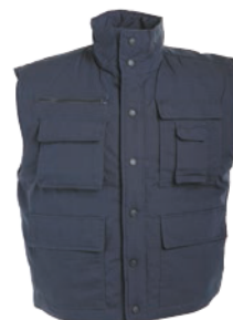
8685x.M tmavě modrá