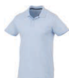
N 7922x.M světle modrá