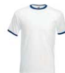
8304x.B bílá/námoňní modrá