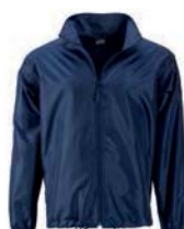
7958x.M námořní modrá