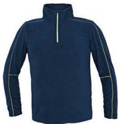
7928x.M námořní modrá/ světle zelená

WELBA, fleecová mikina se stojáčkem pánská fleecová mikina z příjemně měkkého, teplého a prodýsného materiálu ze 100% polyesteru gramáže 150 g/m 2 s výbornými termoizolačními vlastnostmi, stojáček a krátký zip s ochranou brady, dekorativní stehování rukávů, prodloužený zadní díl