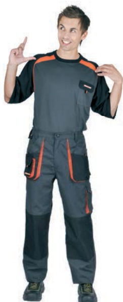
9017x.C do pasu