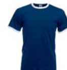
8308x.M námoňní modrá/bílá