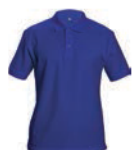
8634x.M královsky modrá