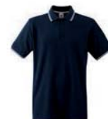
8326x.M námoňní modrá/bílá