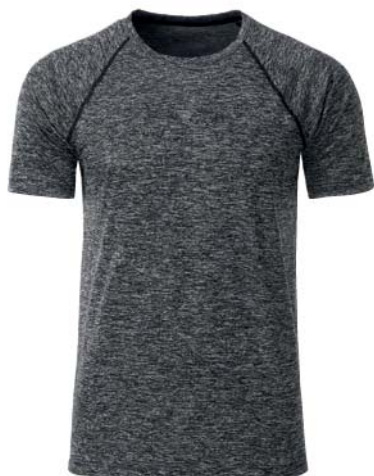
♂ 9670x.C ♀ 7585x.C černý melír/černá