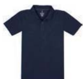
7916x.M námoňní modrá