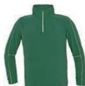
7926x.Z zelená/světle zelená