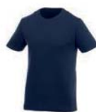
7575x.M námořní modrá