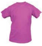
7110x.E tmavě růžová