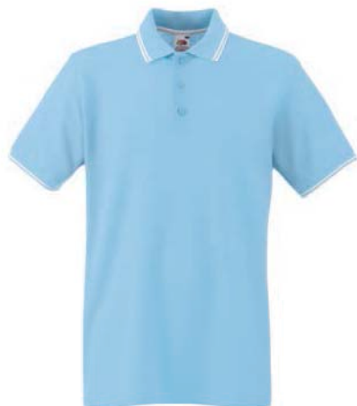
8324x.M nebesky modrá/bílá