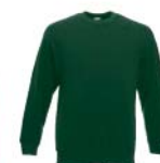
8317x.Z lahově zelená