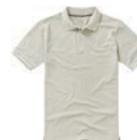
7514x.J světle šedá