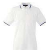
8322x.B bílá/námoňní modrá

Namísto „x“ doplňte v kódu požadovanou velikost: 1=S, 2=M, 3=L, 4=XL, 5=XXL, 6=XXXL