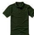
7517x.Z vojenská zelená