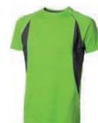
7433x.Z zelené jablko