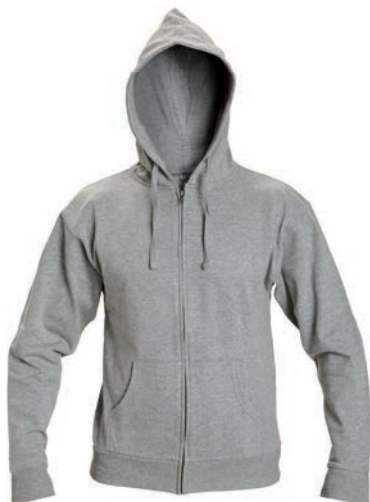
8640x.J šedý melír