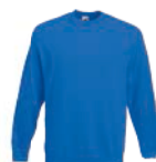
8315x.M královsky modrá