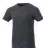
7577x.K tmavě šedá