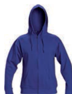
8644x.M královsky modrá