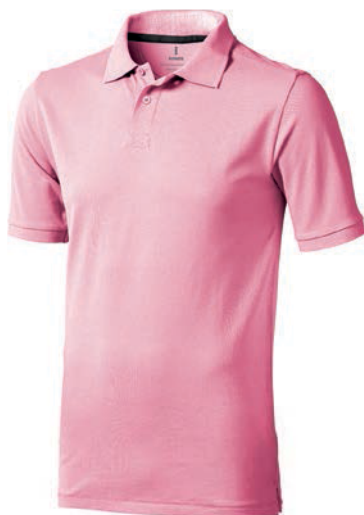
7522x.E světle růžová