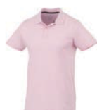
N 7921x.E světle růžová