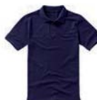
7336x.M námoňní modrá