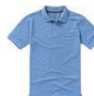
7334x.M světle modrá