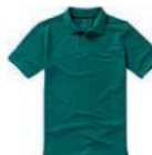
7337x.Z lesní zelená