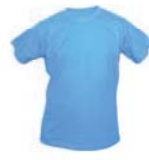
7106x.M azurově modrá