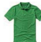
7513x.Z středně zelená