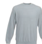
8314x.J šedý melír*